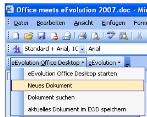
Integration im Office-Menü

Der eEvolution Office Desktop bietet als Zusatz zur ERP-Lösung eEvolution eine einfach zu bedienende Integration in Microsoft Office 2003 und Microsoft Office 2007.